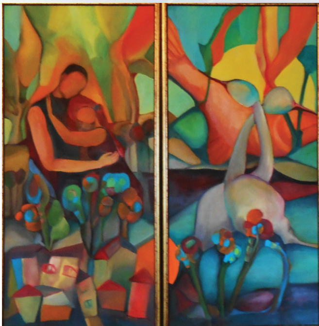
ULICA PEKARSKA PTICE I SAVA