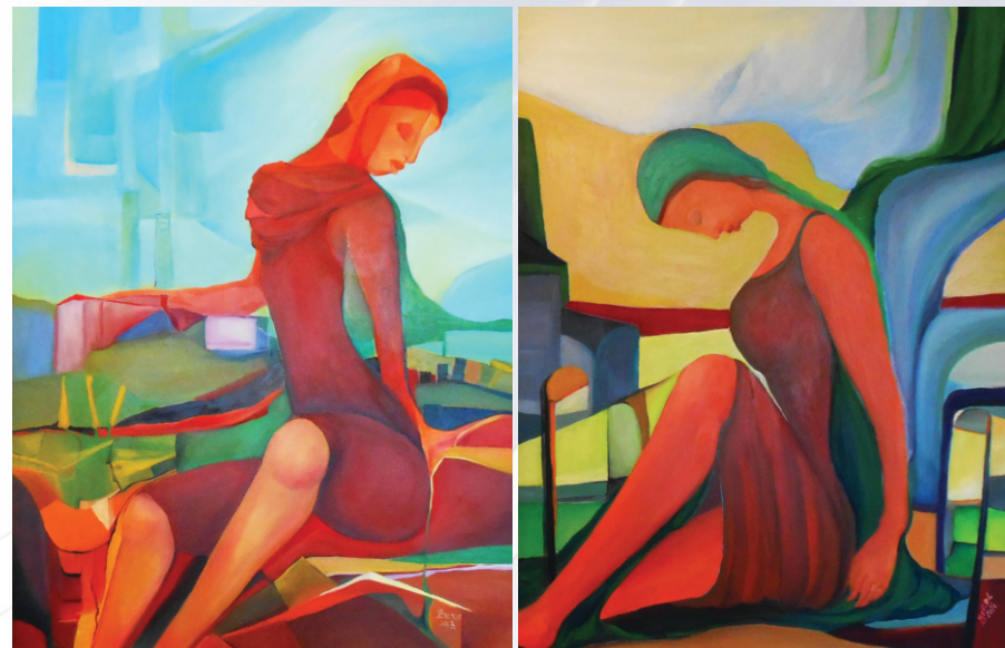
BAKARNA ŽENA 1