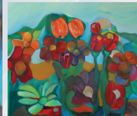
JUTRO U MOJOJ BAŠTI